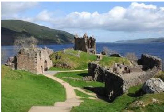
De ruïne van Urquhart Castle

Een klein stukje verder bezoeken we nog Urquhart Castle. Dat zijn ruïnes van een oud kasteel dat echter een heel verrassend bezoekerscentrum heeft. Na dit bezoek gaat het terug richting Inverness. Daar hebben we de rest van de dag vrij voor shopping, de stad te verkennen of te rusten. Je kan ook the Scottish Kiltmaker Visitor Center bezoeken dat zich op amper 100m van het hotel bevindt.